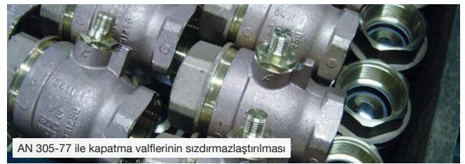
AN 305-77 ile kapatma valferinin sızdırmazlaştırılması

Sertleşme sonrası kimyasallara, solventlere ve -60 ° C ile + 150 ° C arasında sıcaklıklara karşı dirençli , titreşime ve darbeye dayanıklı bir yapıştırıcı bağlantısı meydana gelir.