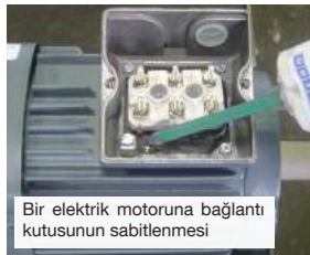
Bir elektrik motoruna bağlantı kutusunun sabitlenmesi