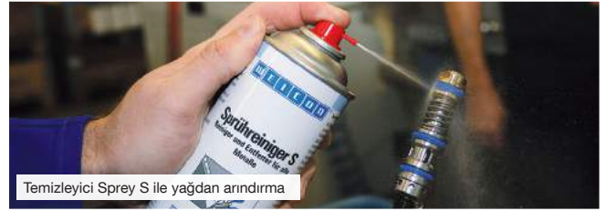
Temizleyici Sprey S ile yağdan arındırma

Yüzeylerin bakımı ve korunması, temizlenme ve yağdan arındırması, yağlaması, çözme ve ayırma işleri için kullanılmaları ile günlük çalışma işlerinin vazgeçilmez bir parçasıdır.