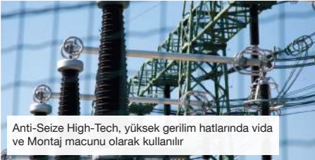
Anti-Seize High-Tech, yüksek gerilim hatlarında vida ve Montaj macunu olarak kullanılır

Korozyona, sıkışmaya ve aşınmaya, oksidasyona, pasla ve elektrolit reaksiyonlara („Soğuk kaynak“) karşı etkili koruma sağlar.