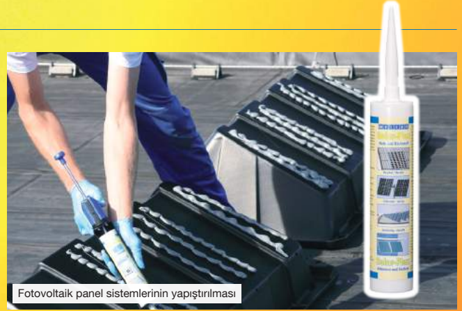
Fotovoltaik panel sistemlerinin yapıştırılması