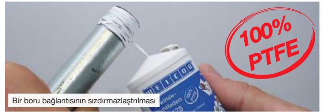
Bir boru bağlantısının sızdırmazlaştırılması

WEICON DF 175 tüm metal ve plastik dişlilerin kalıcı ve güvenli olarak sızdırmazlığını sağlayan %100 PTFE'den yapılan, patenti diş sızdırmazlık ipliğidir. WEICON DF 175 dişlilerdeki ara alanı güvenilir bir şekilde dengeler ve vidalama işlemi sırasında gerekli kalınlıkta PTFE filmi oluşturur.