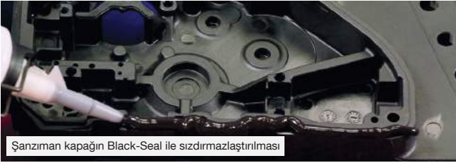
Şanzıman kapağın Black-Seal ile sızdırmazlaştırılması

Elastik yapıştırıcı ve sızdırmazlık malzemeleri günümüzde birçok Endüstriyel alanda üretimde ve montajda kullanılmaktadır. Yapıştırma ve sızdırmazlık teknolojisinin avantajlarını kombine etmektedirler ve birleştirme yerlerinde yüksek elastikiyete ve sızdırmazlığa ihtiyaç duyulan her yerde kullanılmaktadırlar.