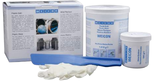
WEICON SF ile hızlı boru onarımı